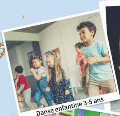
Danse enfantine 3-5 ans