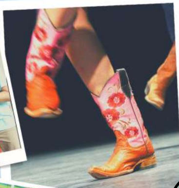
Country 15 ans +