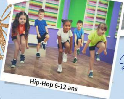
Hip-Hop 6-12 ans