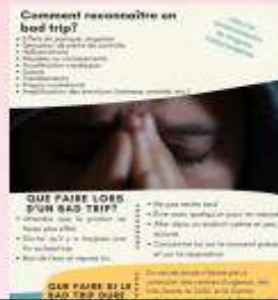
Capsules de prévention