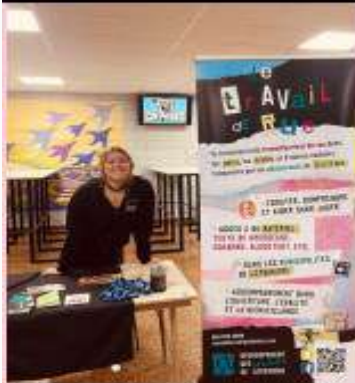
Kiosque dans les écoles