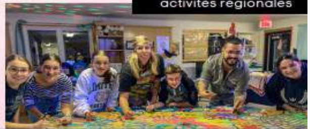
Projets jeunesse et activités régionales