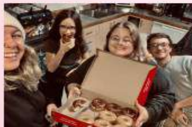
Présences dans les MDJ